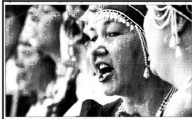
Wo gesungen wird, da lass dich nieder ... 52 22 05:06

auf für ans der che in reit des ger es zu den das Kon- surzer- n and rtrad“ Ku