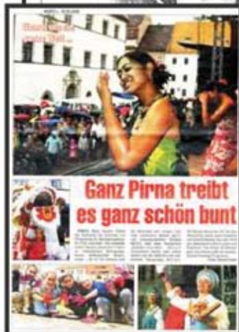
Ganz Pirna treibt es ganz schön bunt